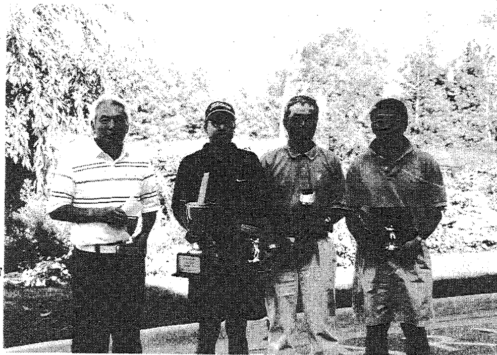
上位3位に入賞された方々